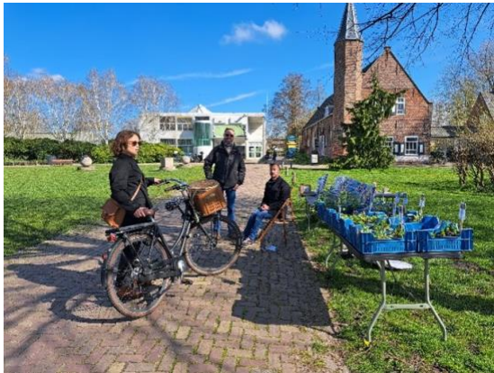
Tegelwipactie: tegels ruilen voor een jong plantje

We namen op 9 september met diverse activiteiten deel aan de Open Monumentendagen en op 23 september deden we met NME Haarlem mee aan de landelijke Tegelwipdag: de Kweektuin was een van de inzamelpunten voor Haarlem Noord.