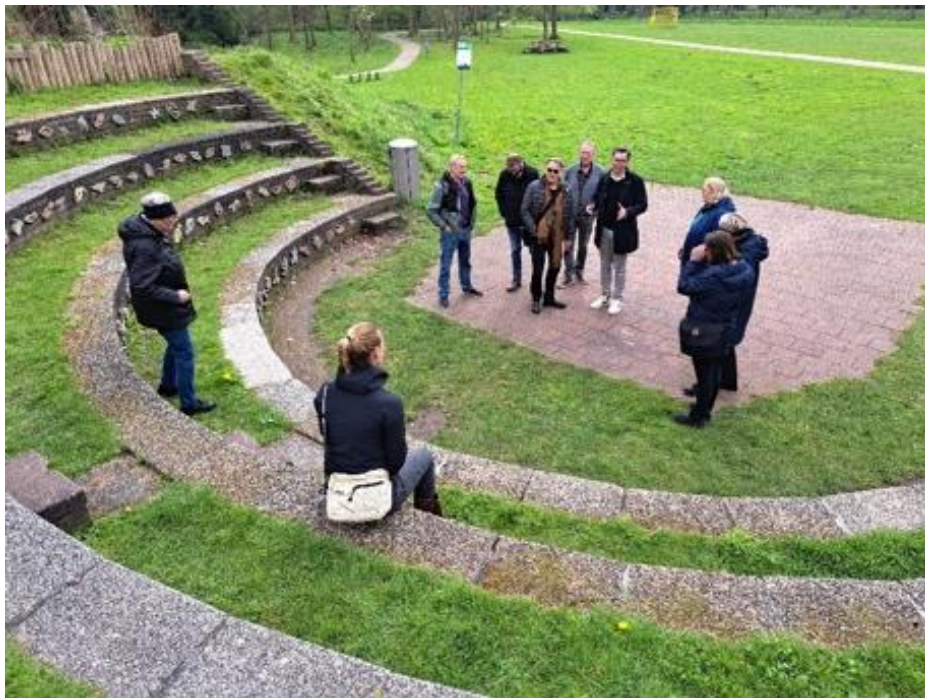
Bezoek aan De Oude Kwekerij in Alkmaar (21-4-2023)